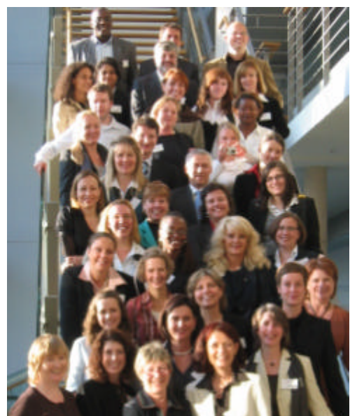
Referenten bei Crossing Bridges 2007